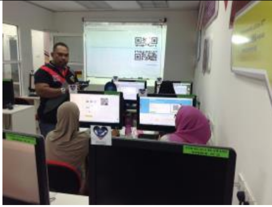
Peserta sedang menjana QR Code masing-masing