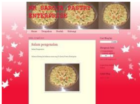
Contoh blog (1) yang dibina oleh peserta bernama Norashikin Bt Zainal Abidin yang mengusahakan kuih seroja