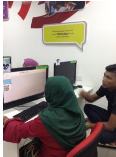
Peserta mengedit QR Code menggunakan paint