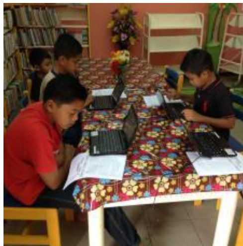
Peserta sedang menaip menggunakan teks yang disediakan