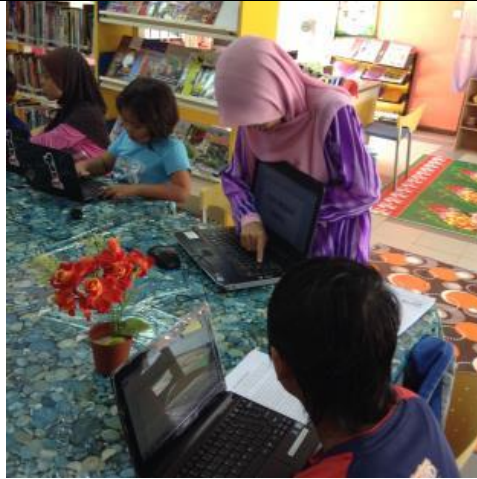
Peserta diterangkan mengenai software&hardware