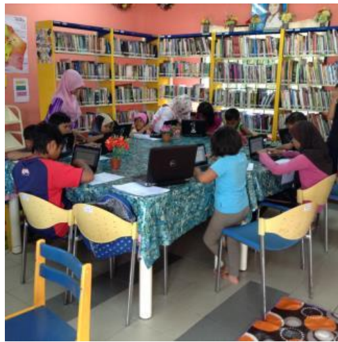
Peserta membuka netbook masing-masing dan mencuba mengenal ikon dan aplikasi