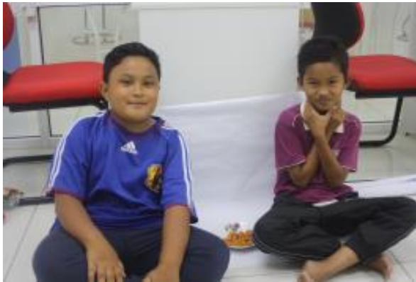
Peserta kumpulan 3 bersama produk mereka