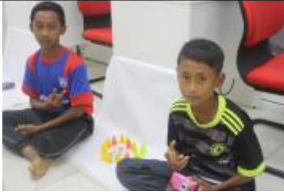
Peserta kumpulan 2 bersama produk mereka