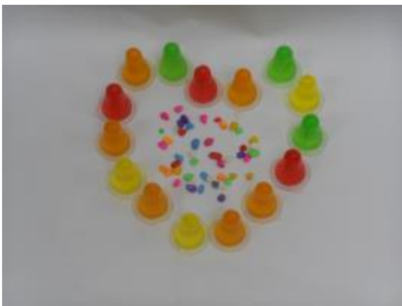
Hasil gambar kumpulan 2