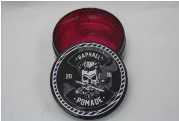
Hasil gambar kumpulan 1