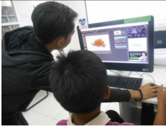
Staf Pi1M membantu peserta memasukkan gambar ke dalam pixlr.com