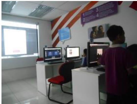
Para peserta sedang menukar saiz gambar, warna, jenis tulisan dan memperbaiki mutu gambar menggunakan "tools" yang berlainan