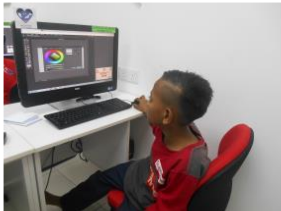
Peserta sedang mempelbagai "style" gambar