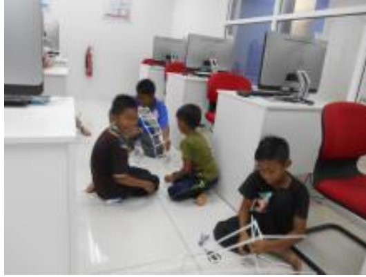
Peserta sedang duduk dalam kumpulan masing-masing