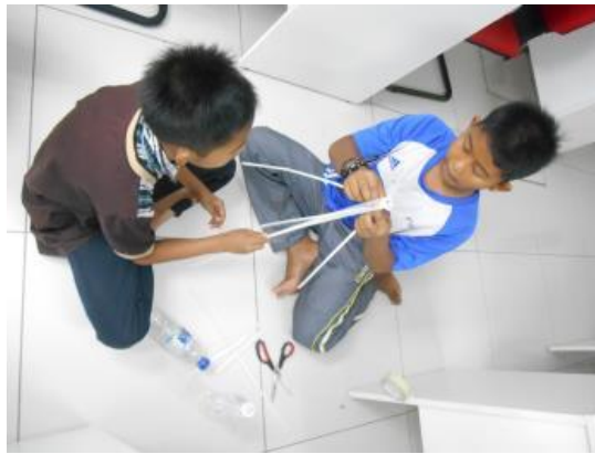
Peserta mendirikan menara masing-masing