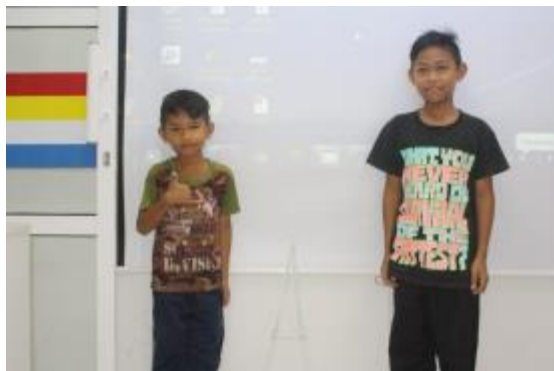
Peserta bersama kumpulan dan hasil karya masing-masing