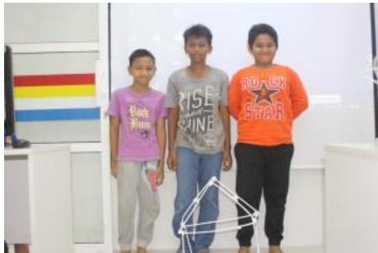
Peserta bersama kumpulan dan hasil karya masing-masing