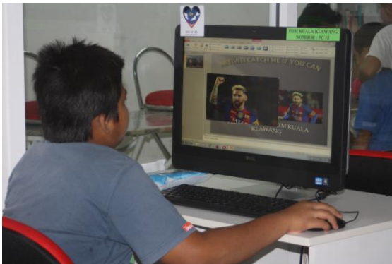
Peserta sedang menambahkan "link" pada persembahan