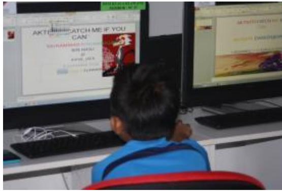
Peserta sedang memasukkan gambar ke dalam persembahan