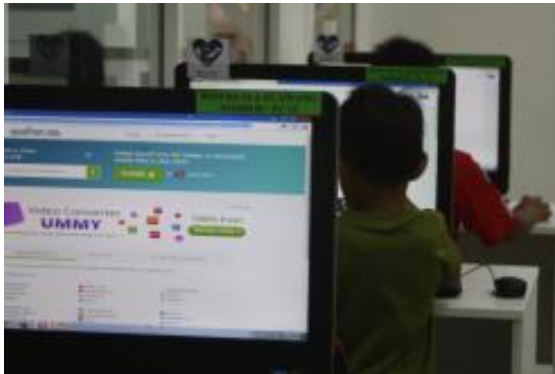
Peserta sedang memuat turun video