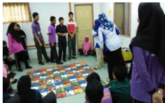
Aktiviti berkumpulan dam ular gergasi