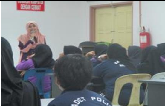
Peserta mendengar taklimat Dashboard