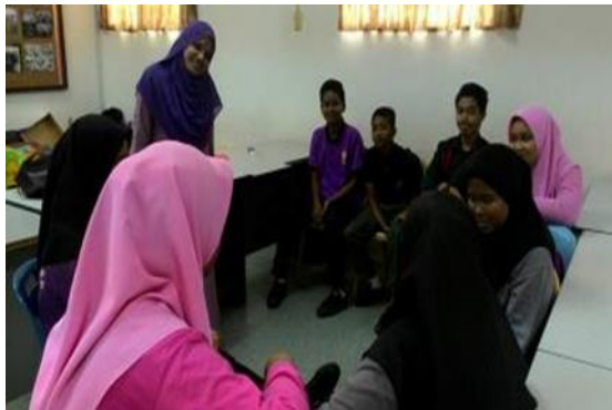
Aktiviti berkumpulan radio rosak