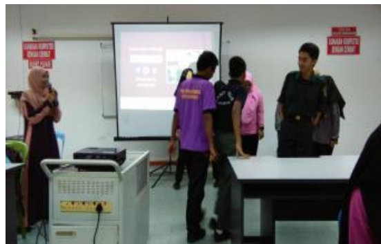
Aktiviti berkumpulan lidah lembut