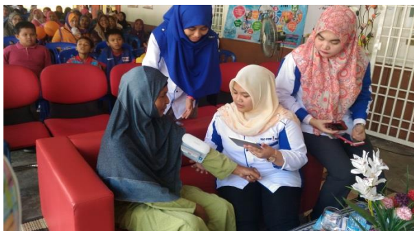
Sesi aplikasi mengambil tekanan darah menggunakan peralatan MyHealth