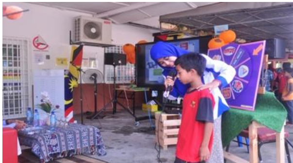
Kuiz roda impian dan kuiz soalan KDB