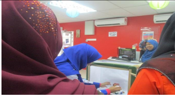
Teknik fotografi bersama usahawan tempatan