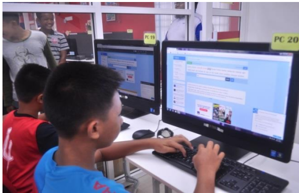
Aktiviti menaip terpantas