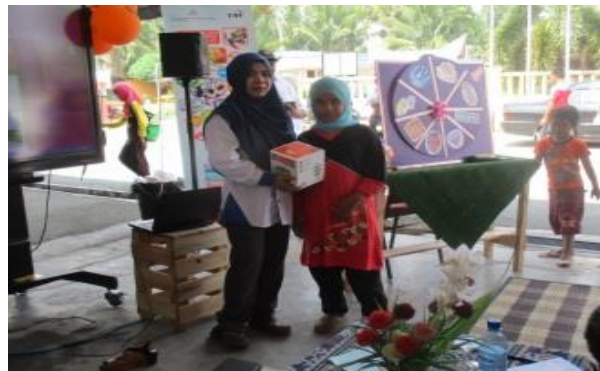
Sesi penyampaian hadiah kepada para pemenang