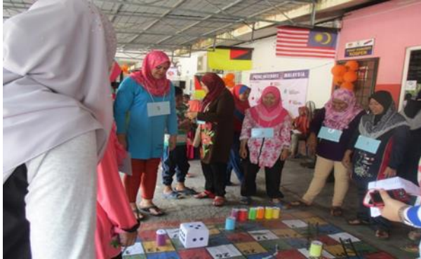
Permainan dam ular