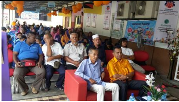
Barisan pengunjung dan VIP yang hadir