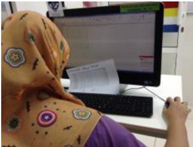
Peserta sedang membuat pengiraan dalam excel