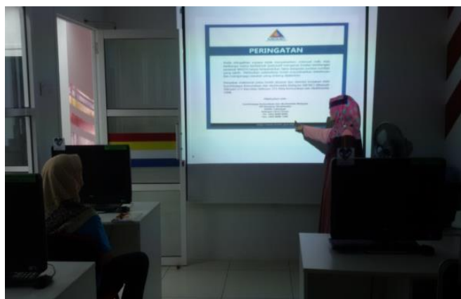
Aktiviti penerangan KDB kepada peserta