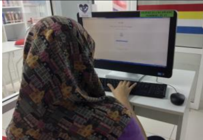
Latihan membuat emel dan menggunakan emel sebagai agen perhubungan