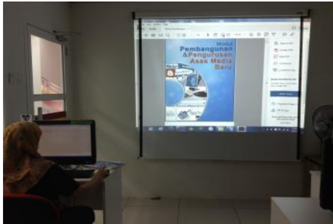
Latihan pengurusan media baru berdasarkan buku yang dibekalkan oleh Pi1M