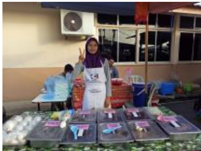
Gambar 2 (i)