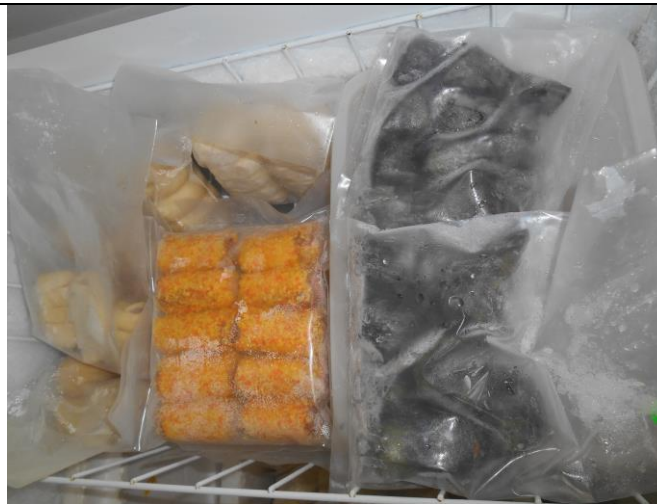
Produk makanan sejukbeku yang diletakkan di dalam freezer di rumah beliau

ii) Lain-lain (contoh : proses penghasilan produk, penglibatan dalam aktiviti lain, dsb)